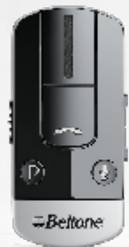
Phone Link 2